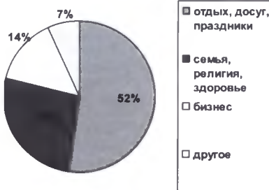
Рис. 1. Въездной туризм в зависимости от цели визита в 2012 году

На рис. 1 представлена информация о долевом распределении въездного туризма в зависимости от цели визита в 2012 г.