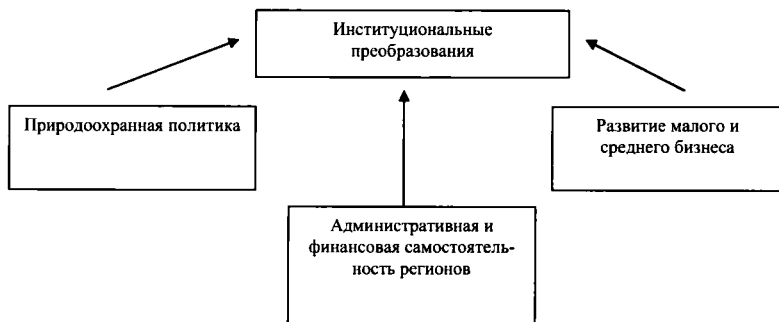
Рис. 2. Ключевые факторы эффективных институциональных преобразований

Создание эффективных региональных институтов необходимо для становления нормативно-правовой основы экономического планирования и функционирования рыночных механизмов, а также для проведения целенаправленной социально-экономической и финансовой политики на местах. Главные механизмы, обеспечивающие базу для развития институтов и институциональной среды на региональном уровне наглядно представлены на рис. 2.