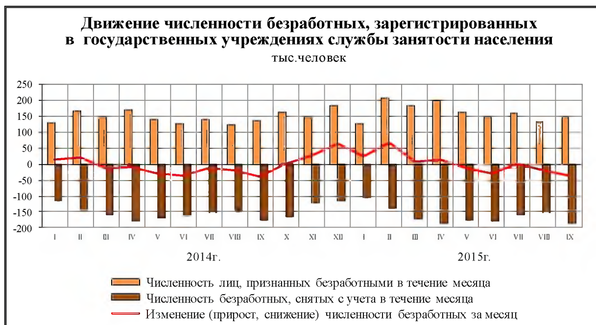
Рис. 2 Движение численности безработных

В сентябре 2015 г. нагрузка не занятого трудовой деятельностью населения, зарегистрированного в государственных учреждениях службы занятости населения, на 100 заявленных вакансий составила 83,9 человека.