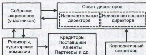
Рис. 1. Англо-американская модель корпоративного управления (обобщение на основе источников [6, 8, 10, 16])

Англо-американская модель. Данная модель характерна для Великобритании, США, Канады, Австралии, Новой Зеландии. В классическом виде ее структура состоит из двух органов управления: общих сборов акционеров и совета директоров. Однако сегодня данная модель встречается в немного измененном виде и включает еще такой орган управления как корпоративный секретарь (рис. 1).