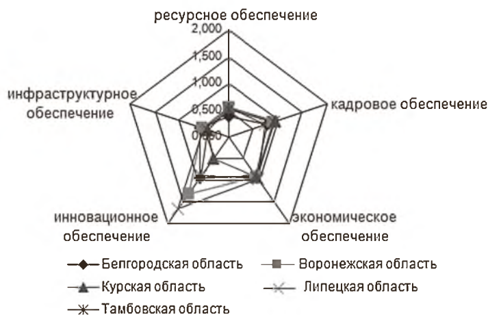
Рис. 1. Обобщенные показатели компонент социально-экономического развития регионов ЦЧЭР в 2010 г.

В соответствии с предложенной методикой проведенный анализ уровня устойчивости социально-экономического развития регионов Центрально-Черноземного экономического района на основе определения базовых и обобщающих показателей компонент социально-экономического развития регионов показал, что наибольший вклад в социально-экономическое развитие для Белгородской, Курской и Тамбовской областей осуществляет кадровое обеспечение, для Воронежской и Липецкой областей – обобщенный показатель инновационного обеспечения. Однако следует отметить во всех исследуемых регионах ЦЧЭР преобладание влияния триады компонент социально-экономического развития: кадрового обеспечения, экономического обеспечения и инновационного обеспечения (рис. 1).