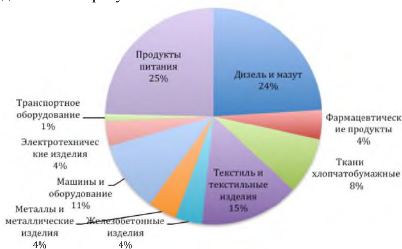
Рис. 3. Доля импорта по товарным группам за 2014 год

Данные таблицы 4 показывают, что импорт продукции на Мадагаскар увеличился, что было вызвано ростом импорта в 2014 году. Доля импорта дизельного топлива и мазута составила 24%; продукты питания - 25%; текстиль и текстильные изделия - 15%; машины и оборудование - 11%. Доля импорта по товарным группам в общем объеме импорта графически представлена на рисунке 3.