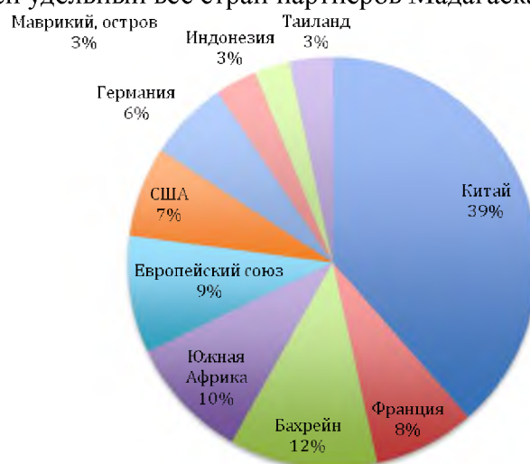
Рис. 2. Доля стран партнеров Мадагаскара по импорту в 2014 году, % Составлено по данным: [3, с.14-19].

По данным таблицы 2 мы видим, что наибольший удельный вес по импорту на протяжении всего рассматриваемого периода занимал Китай, ЮАР, США, Франция. На рисунке 2 представлен удельный вес стран партнеров Мадагаскара по импорту в 2014 году.