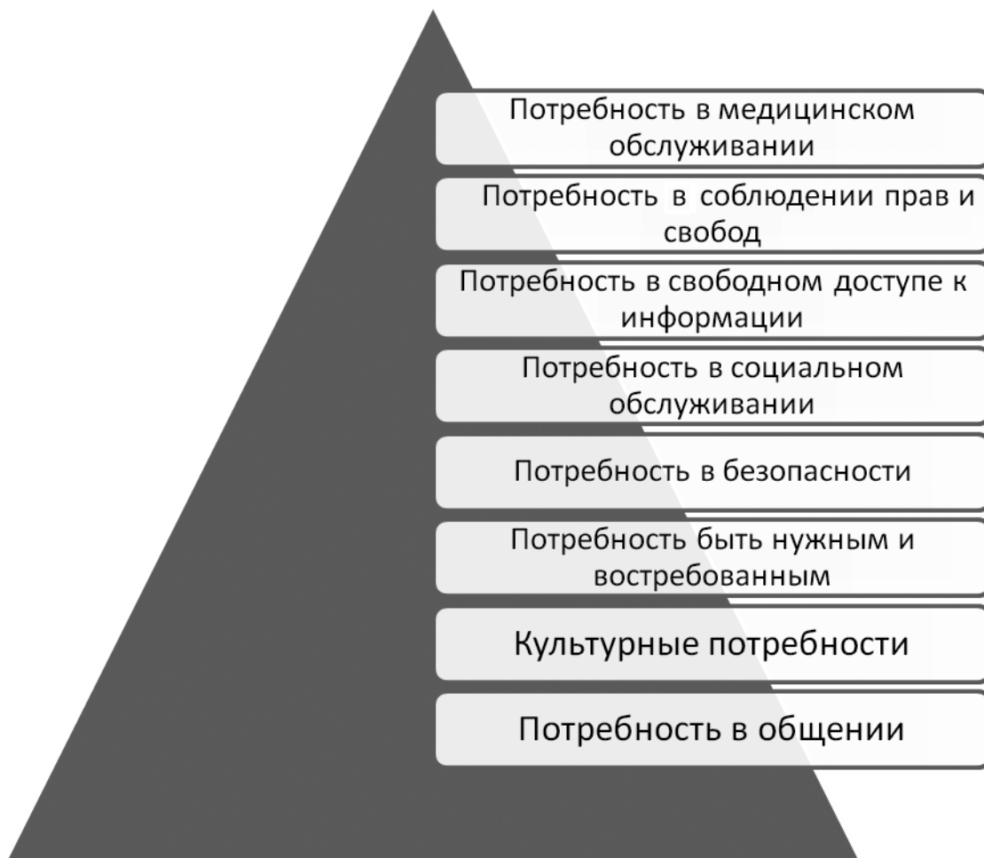
Рис. 2. Пирамида удовлетворенности потребностей людей

твом респонденты считают возможность производить собственные продукты питания (16%). Спокойствие, тишина и удаленность от суеты крупных городов являются огромным преимуществом для многих людей, проживающих в сельской местности (13%). Но более 50% всех респондентов полагают, что культурный уровень сельских жителей ниже, нежели у жителей городских территорий.