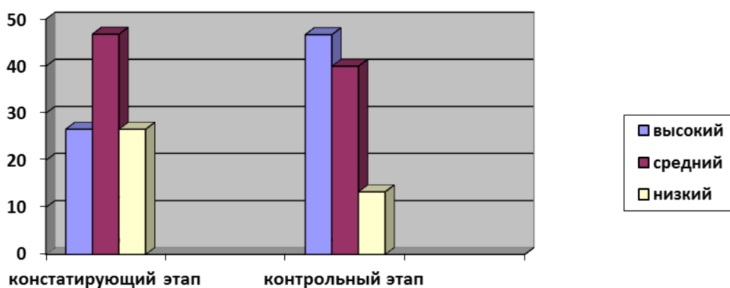
Рис. 2.3. Сравнительная гистограмма результатов диагностики на констатирующем и контрольном этапах исследования

Для выявления динамики в сформированности основ культуры поведения у младших дошкольников на контрольном этапе, мы сравнили результаты диагностики на констатирующем и контрольном этапах (Рис.2.3).