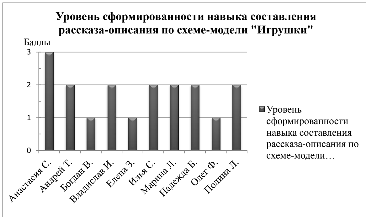
Рис. 2.1. Результаты исследования уровня сформированности навыка составления рассказа-описания по схеме-модели «Игрушки»

по 2 балла, остальные трое испытуемых получили за задание по одному баллу, что соответствует низкому уровню сформированности навыка составления рассказа - описания по схеме-модели «Игрушки». Результаты задания представлены на рисунке 2.1.