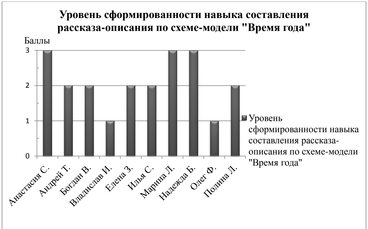
Рис. 2.3. Результаты исследования уровня сформированности навыка составления рассказа-описания по схеме-модели «Время года»