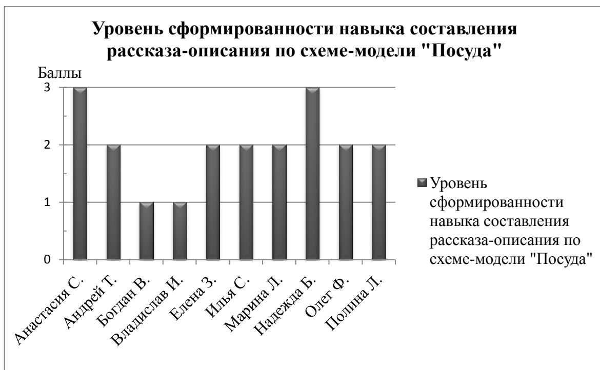
Рис. 2.2. Результаты исследования уровня сформированности навыка составления рассказа-описания по схеме-модели «Посуда»