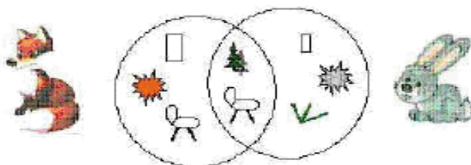
Рис. 1.3. Образец схемы-модели для составления сравнительного описательного рассказа

Однако, В.К. Воробьева использует и схему-модель при обучении детей рассказам-сравнениям при описании-сопоставлении двух объектов. Данная схема-модель помогает ребенку правильно и последовательно построить описание, ориентируясь на качества, свойства предмета, при этом сохраняя сравнительный ряд (см. рис. 1.3) (5).