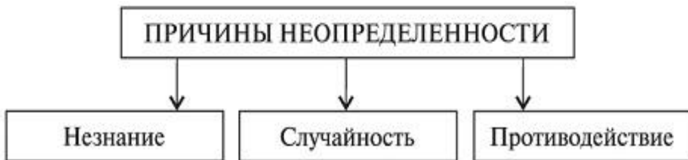
Рисунок 1.1.1 — Основные группы причин возникновения ситуации неопределенности

Что касается рыночной экономики, существуют три основные группы причин возникновения ситуации неопределенности: незнание, случайность, противодействие.