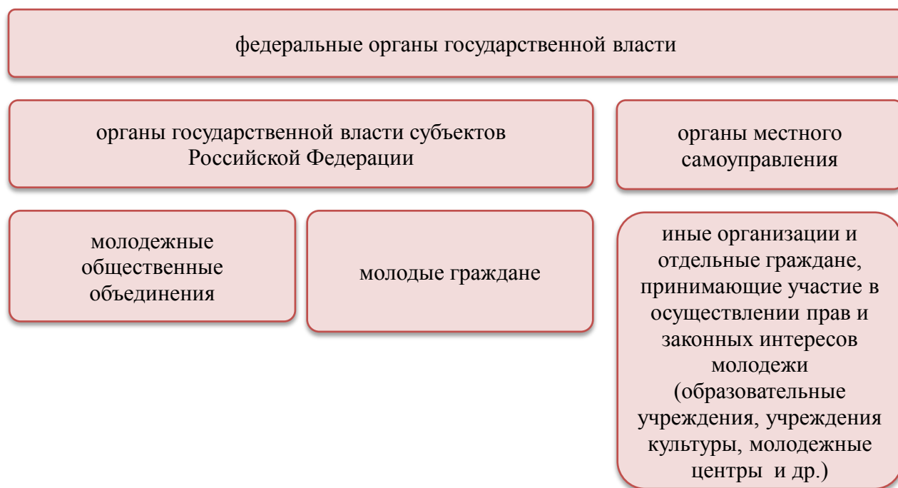
Схема 2. Основные субъекты молодежной политики РФ – участники международного молодежного сотрудничества

Взаимодействие вышеназванных субъектов молодежной политики как организаторов и участников различных международных молодежных площадок должно быть системным, скоординированным, не односторонним процессом и отвечать положениям стратегий и программ в части, касающейся молодежной политики.