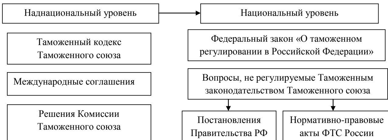
Рис. 1. Структура законодательства в сфере таможенного дела в Российской Федерации

В научных трудах А.А. Костина структура законодательства в сфере таможенного дела в России представлена наднациональным и национальным уровнями (рисунок 1) 1 .