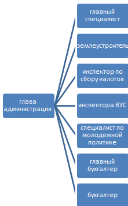
Рис. 1. Структура Администрации Бессоновского сельского поселения