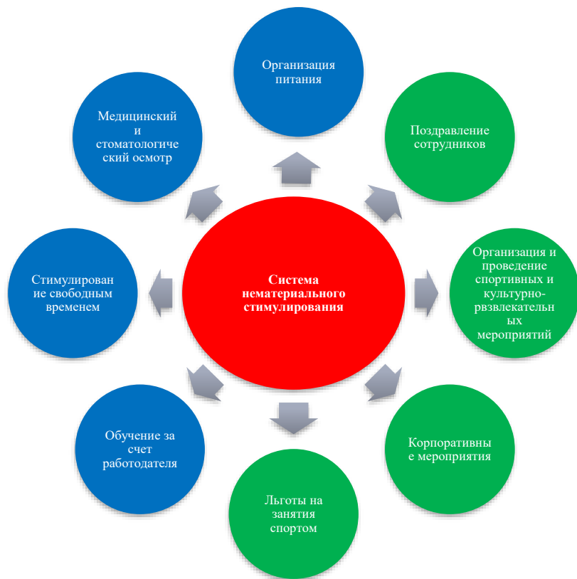
Рис. 3.1 Мероприятия по совершенствованию методов нематериального стимулирования персонала МАУК «ДК «Строитель»,