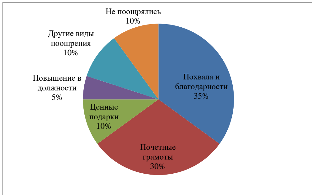
Рис. 2.2 Виды морального поощрения, применяемые в МАУК «ДК «Строитель»»

По данным заместителя директора по административной деятельности, за последний год к работникам МАУК «ДК «Строитель» применялись следующие виды морального стимулирования: похвалу и благодарности со стороны директора получили 35% работников, почетные грамоты получили 30%, ценные подарки 10%, повышение в должности – 5%, у 10% коллектива присутствовали другие виды поощрения, не поощрялись лишь 10% сотрудников (см. рис. 2.2).