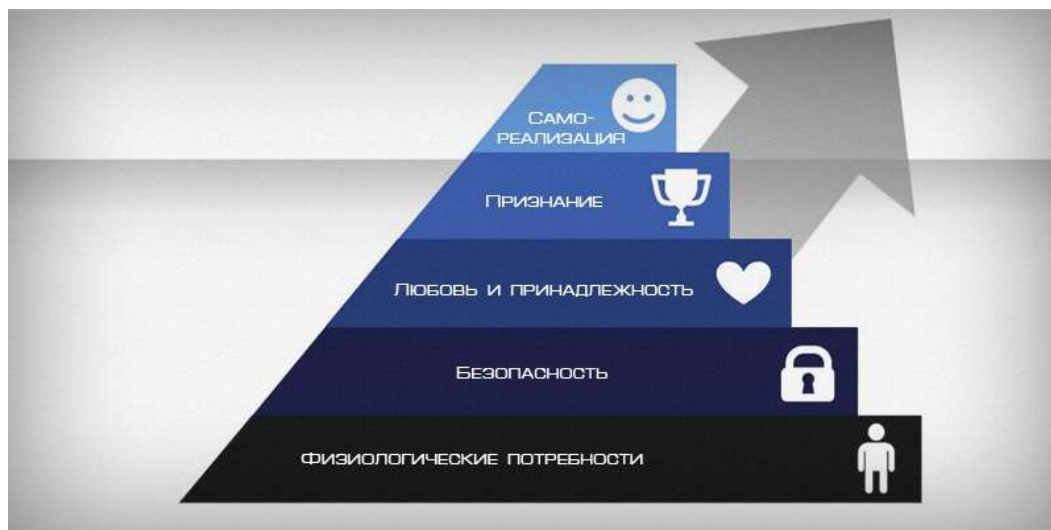
Рис. 1.1 Пирамида потребностей А. Маслоу

Из пирамиды А.Маслоу видно, что физиологические потребности находятся внизу и являются фундаментом, и они очень важны для человека, но такие потребности как социальные, престижные и духовные стоят в вершине пирамиды и для человека являются более ценными.