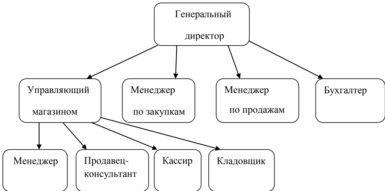
Рисунок 2.1.1 - Организационная структура ООО «Аквилекс»

Механические структуры характеризуются следующими принципами: