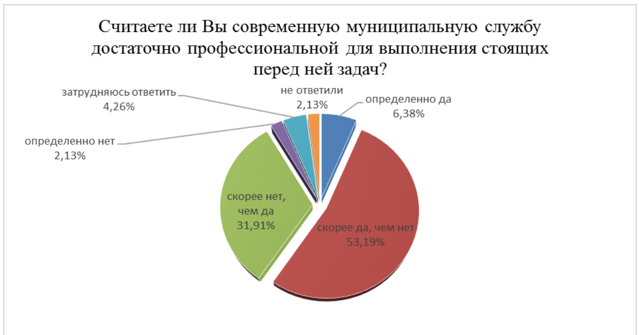
Рис. 2. Распределение ответов респондентов на вопрос о том, насколько способна муниципальная служба решать стоящие перед ней задачи

внутренней и кадровой политики В.А. Сергачева, «проблема качества кадров сегодня вышла на первое место. Повышение эффективности государственного и муниципального управления является важнейшим мериллом, определяющим улучшение качества человеческих ресурсов. От удачного соотношения этих составляющих зависит своевременность и правильность принимаемых решений» 1 . Вместе с тем, муниципальная практика выявила значительное расхождение между процессами социально-экономического реформирования и кадровым обеспечением реформ, что подтверждается результатами проведенного исследования. Так, отвечая на вопрос «Считаете ли Вы современную муниципальную службу достаточно профессиональной для выполнения стоящих перед ней задач?», треть респондентов ответила отрицательно (Рисунок 2). Лишь 6,38 % опрошенных ответили определенно да, в то время как более половины респондентов (53,19%) – с оговорками – «Скорее да, чем нет».