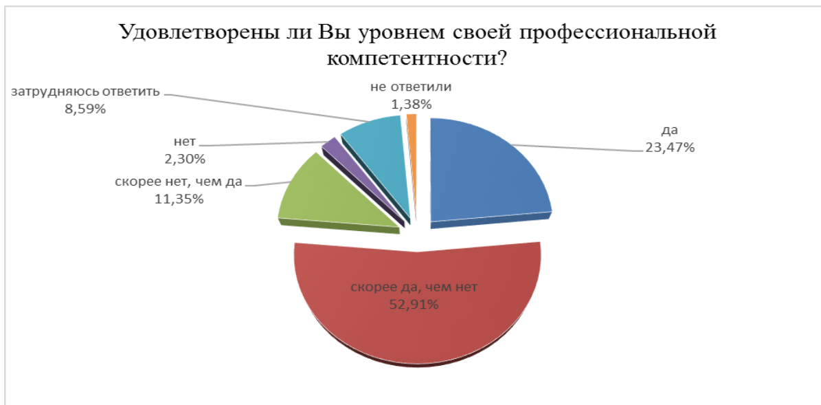
Рис.4. Степень удовлетворенности служащих уровнем своей профессиональной компетентности

(Рисунок 4). Это значит, что общий уровень профессиональной компетентности не оптимален даже в представлениях самих служащих. На наш взгляд, данная ситуация является существенным основанием для развития системы повышения квалификации и переподготовки кадров.