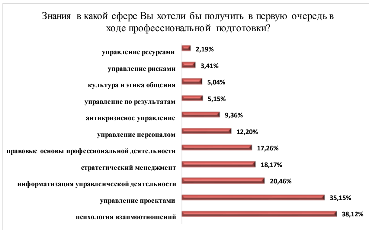
Рис. 11. Функциональный заказ на формирование компетенций служащих

Полученные результаты исследования являются тревожным индикатором понижающегося статуса профессиональной подготовки служащих. С одной стороны, необходимость прохождения обучения и повышения профессионального уровня нормативно закреплено и формально необходимо. С другой стороны, как показывает практика, получение дополнительного образования не способствует повышению статуса в системе управления, что снижает мотивацию служащих к развитию. Сам же процесс обучения зачастую рассматривается служащими как вынужденная обязанность, которая не оправдывает затраченных сил и средств.