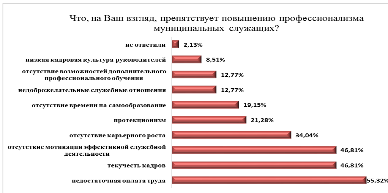
Рис. 10. Факторы, препятствующие повышению профессионализма служащих

«высшая»; либо они убеждены, что влияние дополнительного образования на карьерное продвижение практически отсутствует.