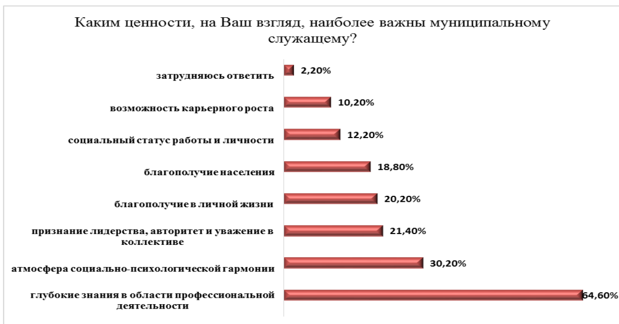
Рис. 8. Распределение ответов респондентов на вопрос о ценностях муниципальных служащих

В ходе исследования муниципальным служащим было предложено выбрать факторы, способствующие и препятствующие повышению их профессионализма. Так, в первую группу респонденты отнесли следующие факторы (Рисунок 9): профессиональное обучение (77,60%), опыт работы (58,57%), перспективы карьерного роста (46,94%). И это вполне логично: для того, чтобы повысить уровень профессионализма, необходимо пройти обучение и закрепить полученные знания, умения, навыки в ходе профессиональной деятельности.