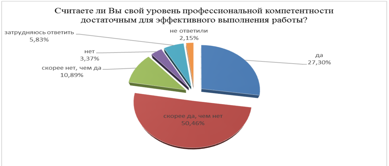
Рис. 5. Распределение ответов респондентов на вопрос о соответствии уровня их компетенции выполнению профессиональных задач

В рамках исследования респондентам было предложено ответить на вопрос о наличие «пробелов» в профессиональной компетенции (Рисунок 6). Так, треть респондентов указала, что в их работе не возникает ситуаций, когда имеет место отсутствие необходимых знаний или навыков для осуществления профессиональной деятельности. Более половины опрошенных (56,13%) сталкиваются с такими ситуациями «иногда»; 2,3% служащих постоянно попадают в ситуации, в которых ощущают недостаток профессиональной компетентности.