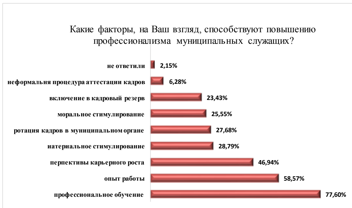
Рис. 9. Факторы, способствующие повышению профессионализма служащих

Среди факторов, препятствующих повышению профессионализма респонденты отметили, в первую очередь, недостаточность оплаты труда (55,32%), текучесть кадров (46,81%) и отсутствие мотивации эффективной служебной деятельности (46,81%) (Рисунок 10).