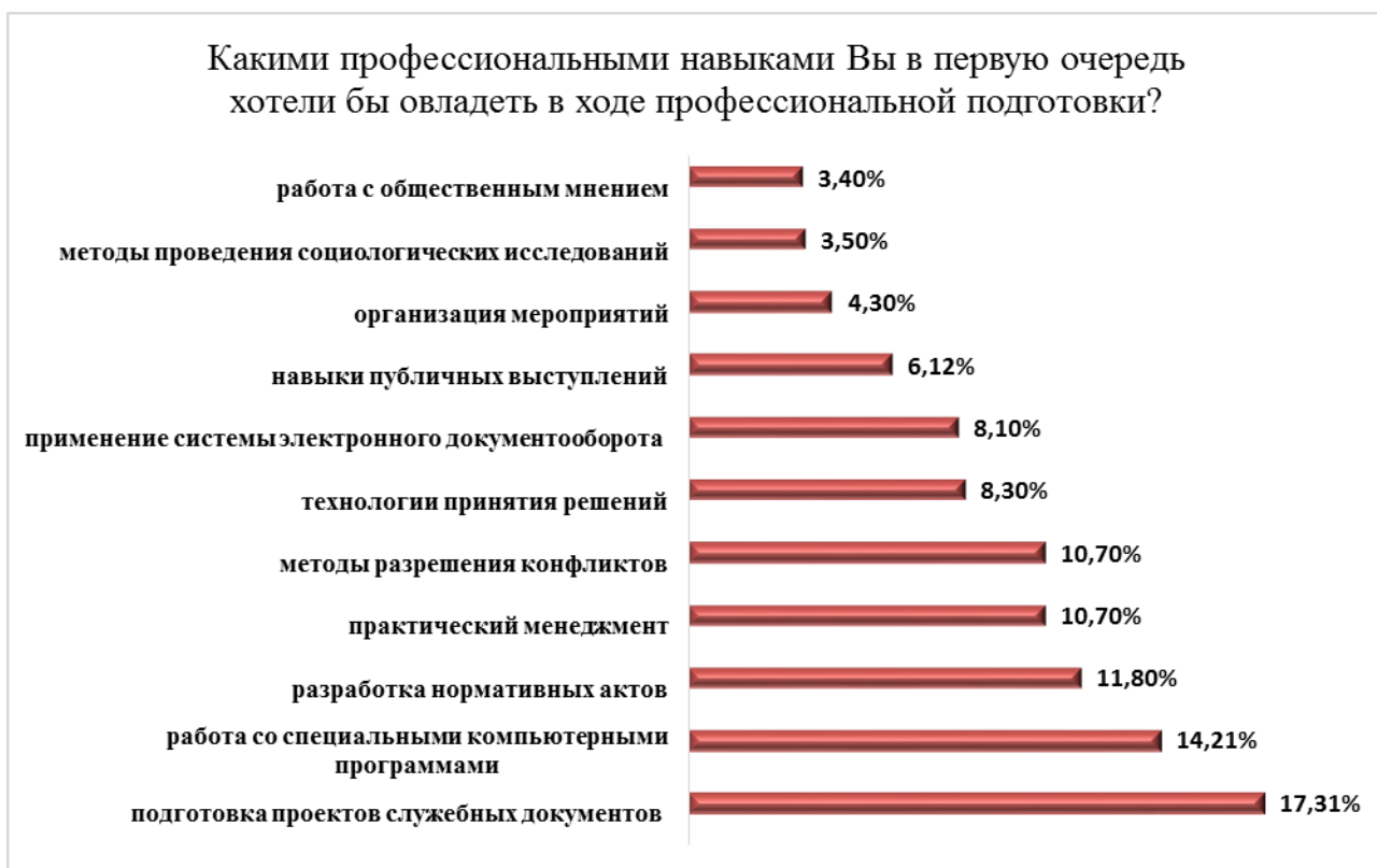
Рис.12. Профессиональный заказ служащих на овладение новыми навыками

Проведенный анализ практики профессионализации муниципальных служащих администрации города Белгорода, позволил вывить ряда объективных и субъективных причин, затрудняющих развитие профессиональной деятельности, главными из которых являются: