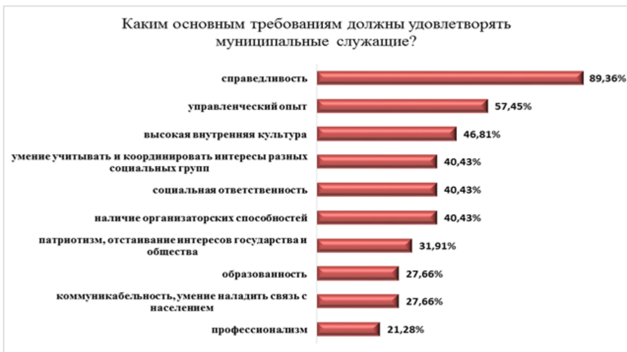
Рис. 7. Распределение ответов респондентов о предъявляемых требованиях к муниципальным служащим