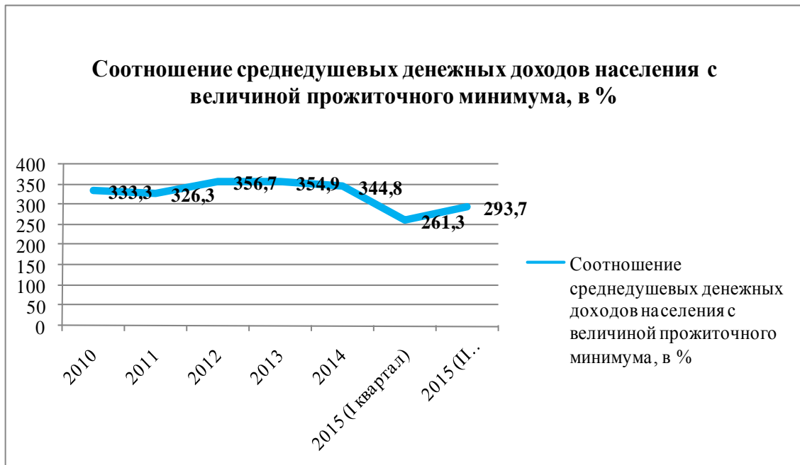
Рис.1.1. Соотношение среднедушевых денежных доходов населения с величиной прожиточного минимума (2010-2015 гг.), % 1 .

При условии, что в настоящее время (на 11.09.2015 г.) средний прожиточный минимум по стране на душу населения составляет 10 017 рублей, а средний прожиточный минимум на ребенка за 2 квартал 2015 года составил 9 806 рублей 2 , то среднедушевой доход в размере 29 281 рубль дает возможность для того, чтобы содержать одного ребенка или, с большим трудом, двух детей. Эти данные показывают, насколько напряженным является экономическое положение среднестатистической российской семьи.