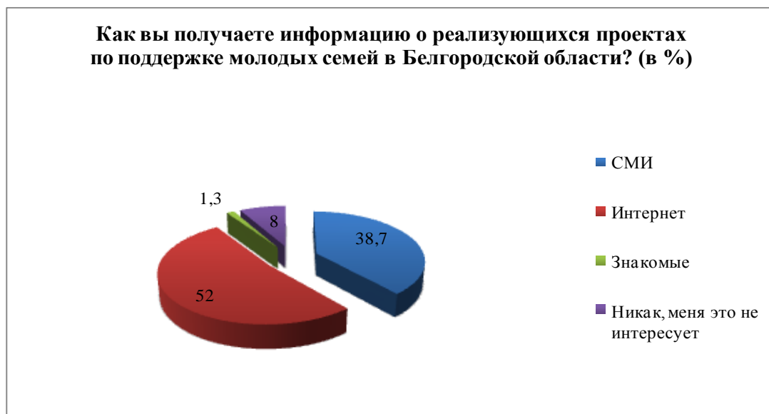
Рис.2.3. Распределение ответов на вопрос «Как вы получаете информацию о реализующихся проектах по поддержке молодых семей в Белгородской области?»

Респондентам был задан вопрос о том, каким образом молодым семьям хотелось бы получать информацию о проектах. В результате были получены следующие ответы: 86,7 % хотели бы получать информацию через интернет, так как считают это наиболее удобным способом для получения информации, 10 % выбрали вариант «через СМИ», 2% устраивает рассылка по почте и 1,3% не хотели бы получать такую информацию вообще.