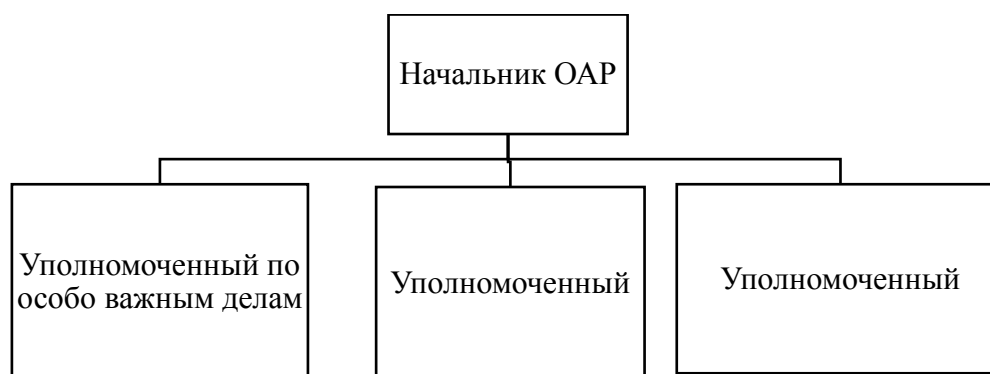
Рис.1 . Организационная структура отдела административных расследований

ОАР входит в организационную структуру ТП МАПП «Нехотеевка» Белгородской таможни (Рисунок 1).