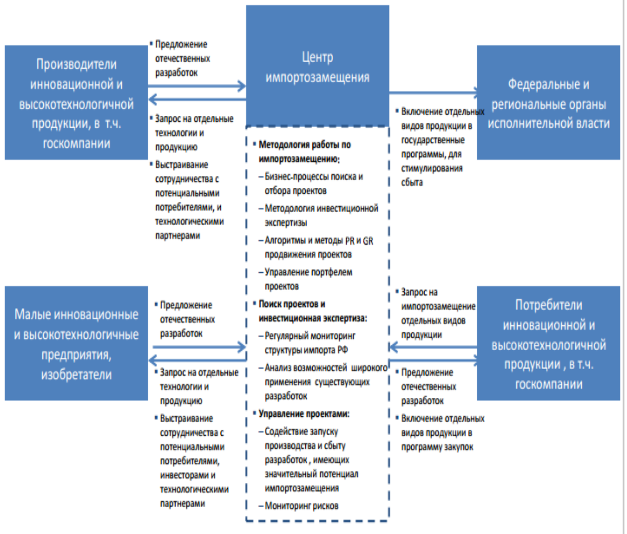
Рис. 3. Целевая модель Центра импортозамещения Белгородской области.

Целевая модель Центра импортозамещения Белгородской области представлена на рис. 3.