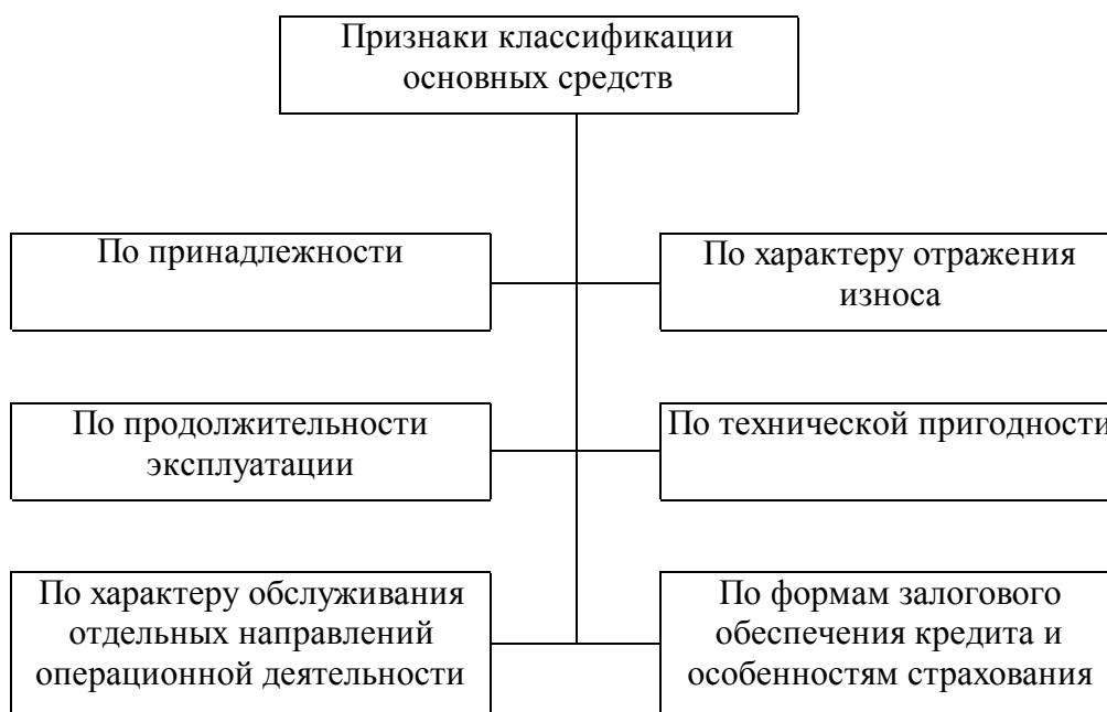
Рис. 1.1. Классификация основных средств бюджетных организаций

Их классификацию можно наглядно увидеть на рисунке 1.1.