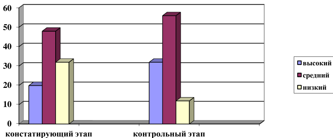
Рис. 2.2. Уровень нравственной воспитанности младших школьников на констатирующем и контрольном этапах экспериментальной работы

Динамика уровня нравственной воспитанности младших школьников на констатирующем и контрольном этапах экспериментальной работы показана на диаграмме (Рис. 2.2).