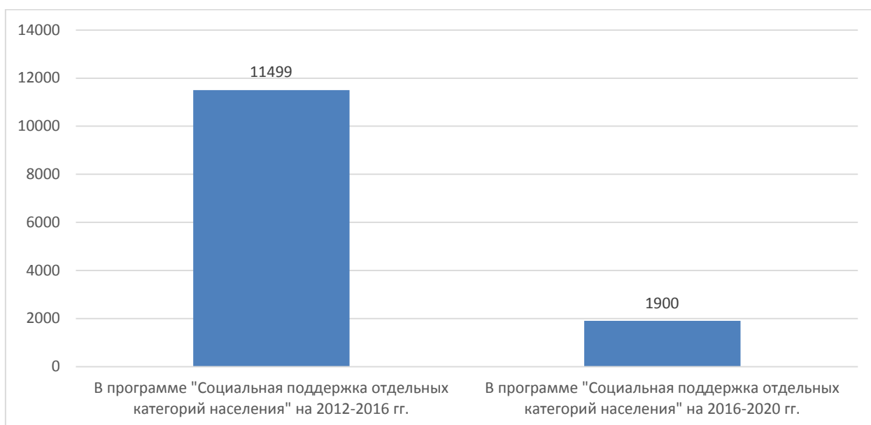
Рис. 3. Бюджетные расходы на обеспечение доступной среды для инвалидов в первой и второй редакциях муниципальной программы «Социальная поддержка отдельных категорий населения», тыс. руб.

Данные факты, с одной стороны, свидетельствуют о высоких достижениях в области формирования доступной среды в период с 2012 по 2016 годы, с другой стороны, утверждают, что организация доступной среды для инвалидов на сегодняшний день – задача не столько системная, сколько фрагментарная, ситуативная.