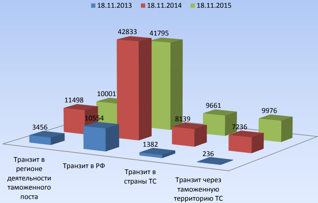
Диаграмма оформления транзитов в регионе деятельности валуйского ТП