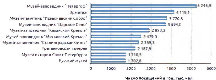
Рис. 3. Самые посещаемые музеи Российской Федерации [3]