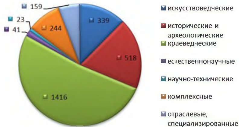
Рис. 2. Типизация музеев и их филиалов по специализации

По планировочной организации территории застройки, в Российской Федерации, музейные дестинации бывают 4 видов: концентрические, рассредоточенные, линейные (коридорные), смешанные. Для музейной дестинации «Прохоровское поле» характерна смешанная планировочная организация территории, поскольку 60% музеев и объектов инфраструктуры расположены компактно вдоль транспортной оси ТРС, другие же 40% объектов, находятся на значительном удалении от центра дестинации.