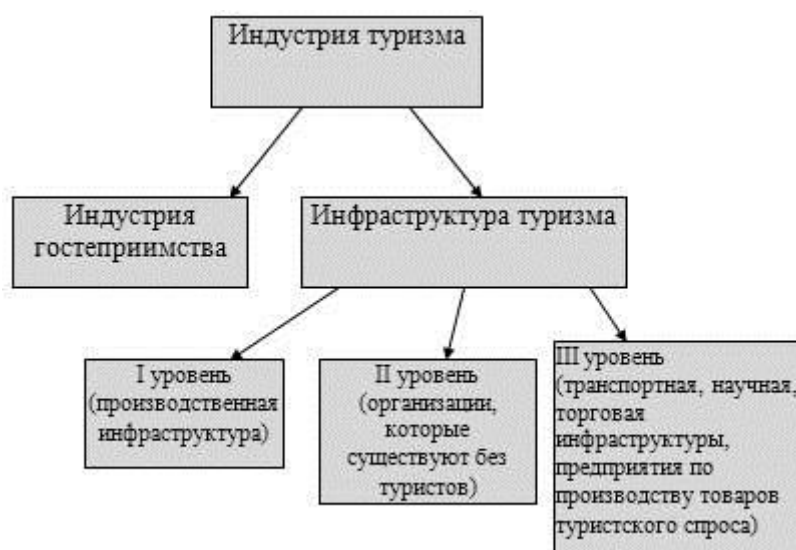
Рис. 1.1. Инфраструктура туризма как часть индустрии туризма

Для того чтобы район стал привлекательным для туристов нужны не только туристические ресурсы, но и туристическая инфраструктура и индустрия гостеприимства, которые являются основными элементами индустрии туризма (рис. 1.1.).