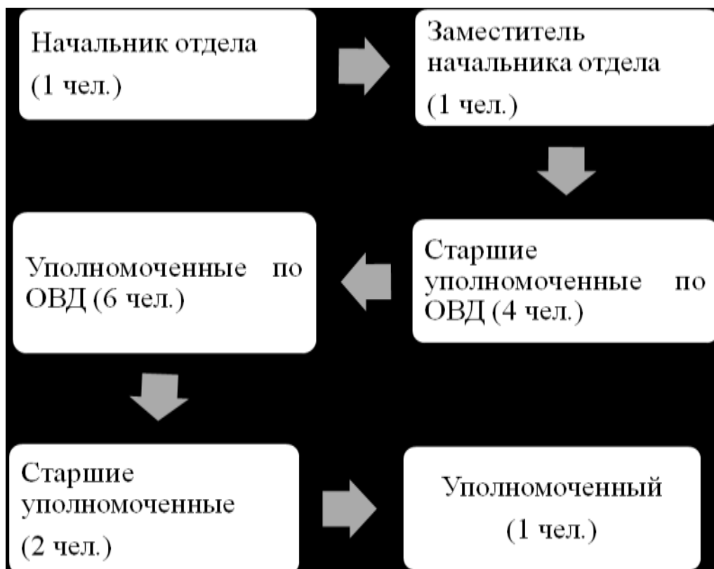
Рис. 1. Организационная структура отдела административных расследований Белгородской таможни

В настоящее время преступления в сфере таможенного дела являются одним из распространенных видов преступной деятельности, наносящих существенный ущерб экономическим и политическим интересам Российской Федерации.