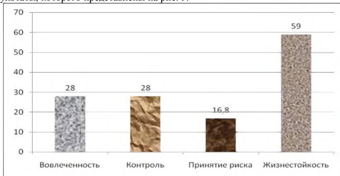
Рис. 3. Выраженность показателей жизнестойкости личности подростков (ср.б.)

Проанализируем особенности жизнестойкости личности подростков, полученные нами при помощи использования теста жизнестойкости (С. Мадди) результаты, которого представлены на рис. 3.