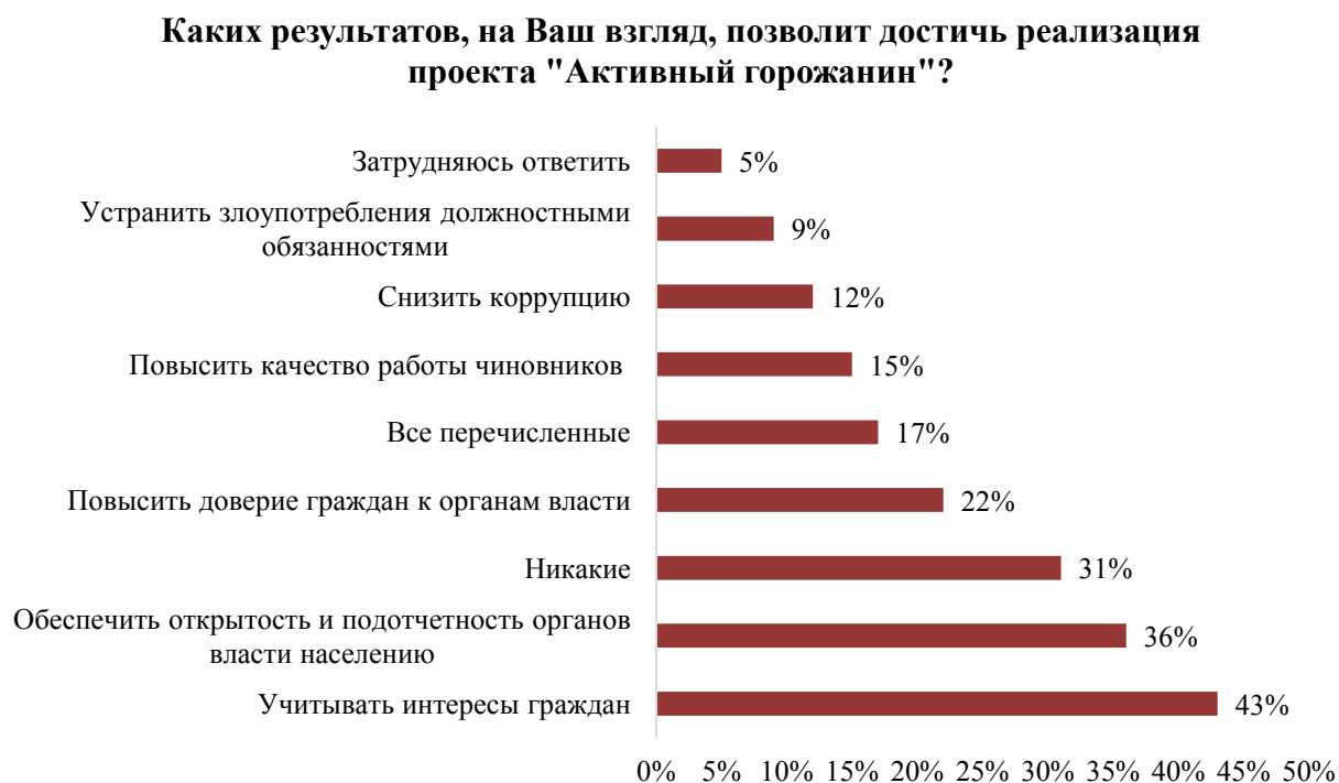
Рис.3. Оценка респондентами результатов реализации проекта «Активный горожанин»

В рамках опроса жителям было предложено оценить потенциальные результаты реализации проекта «Активный горожанин». По мнению респондентов, реализация проекта позволит, во-первых, учитывать интересы граждан (43%); во-вторых, обеспечить открытость и подотчетность органов власти населению (36%); в-третьих, повысить доверие граждан к органам власти (22%). Вместе с тем, треть опрошенных убеждена, что никаких значимых изменений проект не принесет (31%).