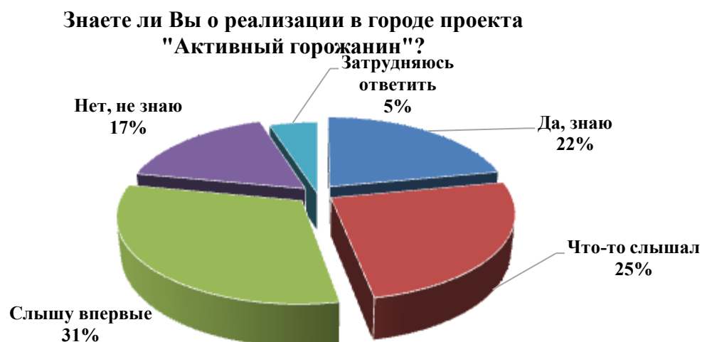
Рис.2. Информированность респондентов о реализации проекта «Активный горожанин»

В рамках опроса жителям было предложено оценить потенциальные результаты реализации проекта «Активный горожанин». По мнению респондентов, реализация проекта позволит, во-первых, учитывать интересы граждан (43%); во-вторых, обеспечить открытость и подотчетность органов власти населению (36%); в-третьих, повысить доверие граждан к органам власти (22%). Вместе с тем, треть опрошенных убеждена, что никаких значимых изменений проект не принесет (31%).