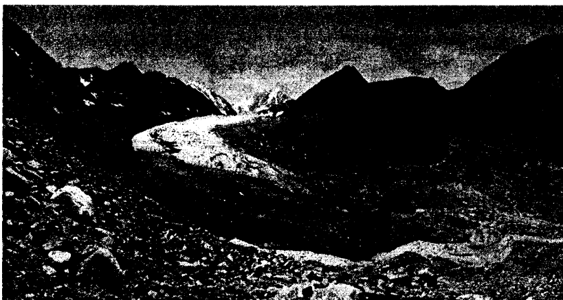
Рис. 2. Язык ледника Менсу (Сапожникова) в 2004 г. (фото О.В.Останина)

годы привело к полному освобождению ото льда нижней ступени, с которой он спускался до 1934 г. Полностью вытяял бараний лоб ....» (с. 145). К 1985 г. ледник отступил до высоты 2120 м. На фотоснимке, любезно предоставленном В.С. Ревякиным, видно, что основные водные потоки идут от левой части ледникового языка и проходят ущелье у «Красной лестницы». Сегодня здесь наблюдается незначительный водоток.