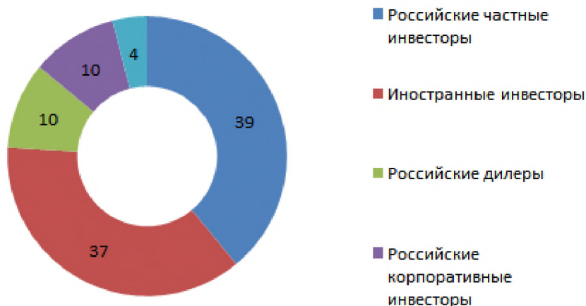
Рис.2. Структура фондового рынка по типу клиентов за 2016 год

Следует заметить, что в России имеются отличительные черты, не характерные зарубежному опыту. Так регистраторы и депозитарии имеют мощную взаимосвязь, которая закреплена на основе соглашений. Кроме того, задачи расчетной палаты и депозитария выполняет лишь одна структура НКО «Национальный Расчетный Депозитарий». Рассматривая отечественную структуру фондового рынка по типу инвесторов, было выявлено, что наибольшую долю занимают частные российские и иностранные инвесторы (рис.2.).