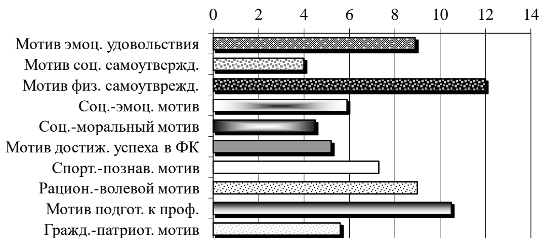
Рис. 4. Выбор мотивов физкультурной деятельности в группе студентов, ориентированных на избегание неудач (в баллах)

Студенты, ориентированные на избегание неудач (16 чел.), показали значительно более низкие результаты по этим же мотивам (рис. 4). Наиболее значимым для данных респондентов является мотив физического самоутверждения (хочу быть здоровой), далее – мотив эмоционального удовольствия (физкультура поднимает настроение) и подготовки к профессиональной деятельности (если не будешь болеть, лучше сможешь учиться и работать). Эти студентки не хотят улучшать личные достижения в области физической культуры, не стремятся к дополнительным занятиям и тренировкам.