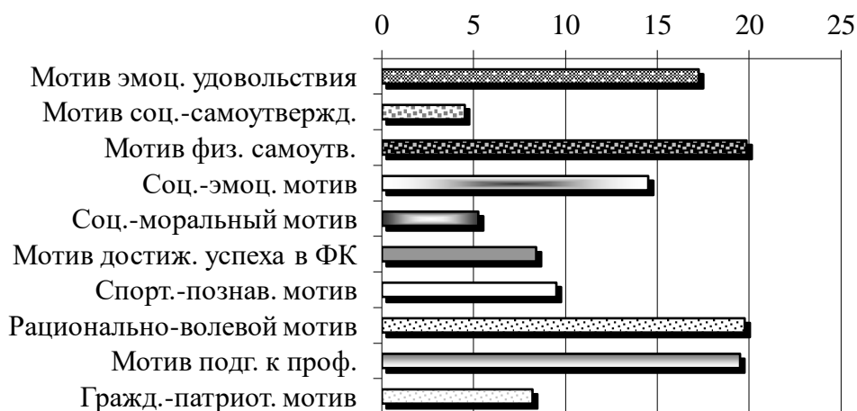
Рис. 3. Выбор мотивов физкультурной деятельности в группе студентов, ориентированных на успех (в баллах)

Студенты, ориентированные на избегание неудач (16 чел.), показали значительно более низкие результаты по этим же мотивам (рис. 4). Наиболее значимым для данных респондентов является мотив физического самоутверждения (хочу быть здоровой), далее – мотив эмоционального удовольствия (физкультура поднимает настроение) и подготовки к профессиональной деятельности (если не будешь болеть, лучше сможешь учиться и работать). Эти студентки не хотят улучшать личные достижения в области физической культуры, не стремятся к дополнительным занятиям и тренировкам.