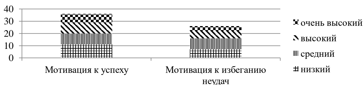
Рис. 2. Степень стремления к успеху или избеганию неудач (кол-во респондентов)

В каждой из указанных подгрупп прослеживается чёткая дифференциация степени стремления к успеху у одних и к избеганию неудач у других. 25 % от общего количества респондентов показали высокий и очень высокий уровни стремления к успеху, то есть они активны, проявляют инициативу, любят ставить перед собой сложные задачи, самостоятельно ищут пути её решения. У 17 % студентов очень высокий и высокий уровни стремления к избеганию неудач, то есть для них важно найти причину отказа от ответственного задания, отыскать внешнее основание неудачи в деятельности, у них не хватает силы воли, настойчивости, целеустремлённости (рис. 2).