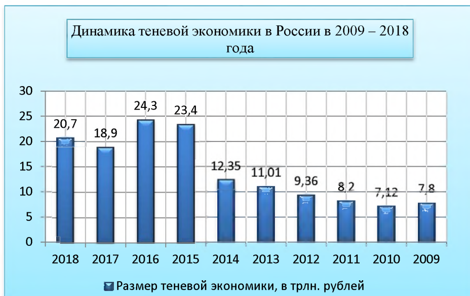
Рис. 1. Динамика теневой экономики в России в 2009-2018 года

Расчет был произведен с учетом нелегальных и неправильно задекларированных импортных товаров, криминально составляющей, скрытого дохода юридических лиц и неофициальной зарплат рабочих, которая выплачивается в обход налогового законодательства. Четвертую часть от общей суммы составляют «чёрные» зарплаты и прибыль от криминального бизнеса. Так как данные о получении неформальной прибыли нигде не фигурируют, то долю теневого дохода можно определить, используя информацию о расходах граждан в нашей стране.