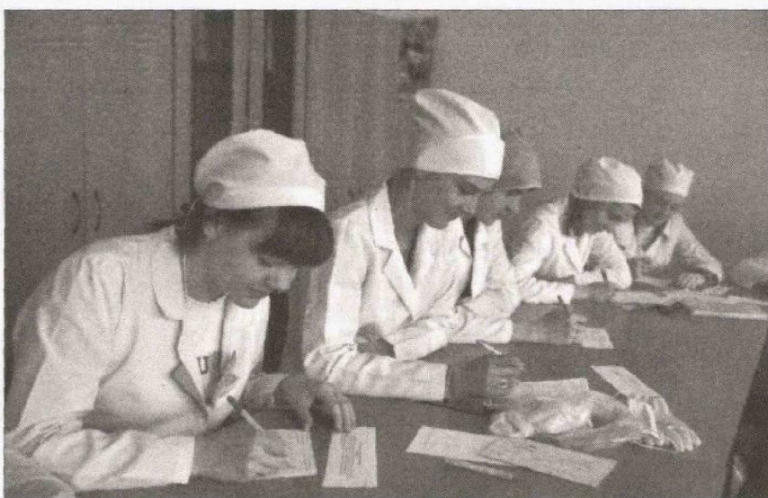
Будущие медицинские сёстры сдают зачёт