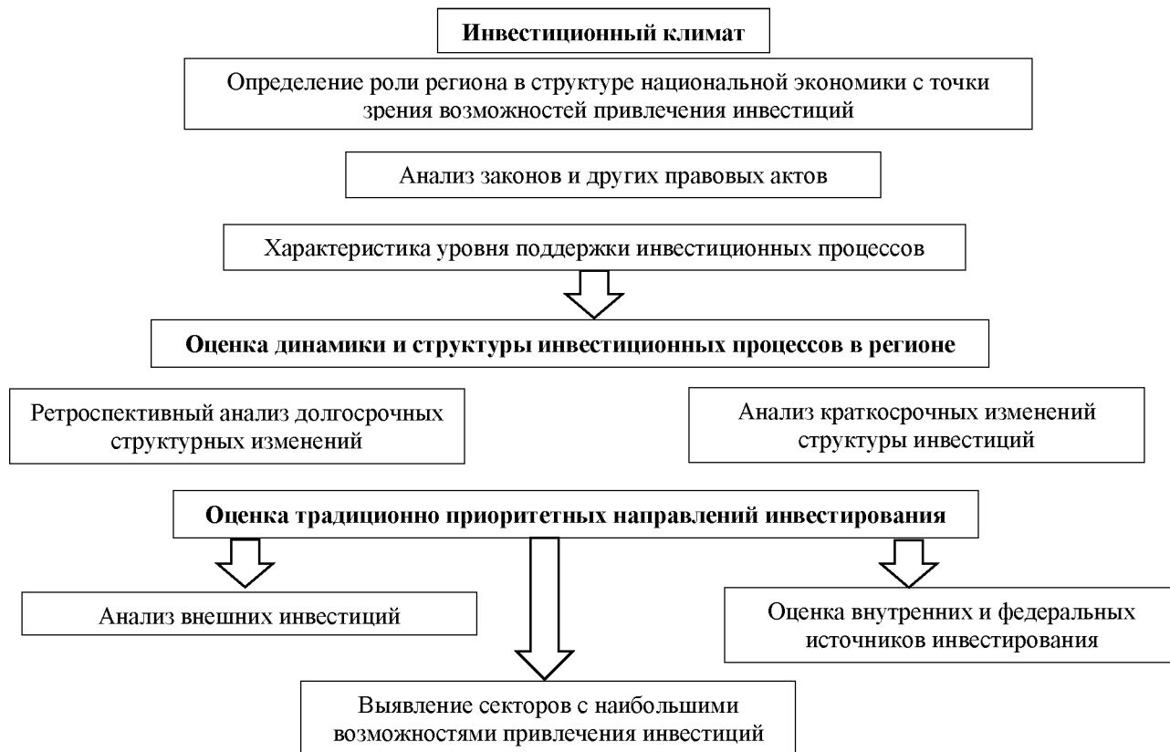
Рис. 1. Алгоритм оценки потенциала устойчивого развития региона Составлено автором.

В итоге хотелось бы подчеркнуть, что комплексная оценка инвестиционного потенциала региона предполагает: существование обоснованной и научно выверенной системы показателей, а также наличие статистической базы. Вместе с тем следует отметить, что показатель инвестиционного потенциала не только предопределяет дальнейшее развитие региона, но и характеризует степень готовности региона к созданию, освоению и распространению разного типа нововведений, к реализации результатов инвестиционной и инновационной деятельности. В итоге рассмотрения данного вопроса можно сказать, что оценка инвестиционной привлекательности региональной экономики является важнейшим аспектом принятия любого инвестиционного решения.