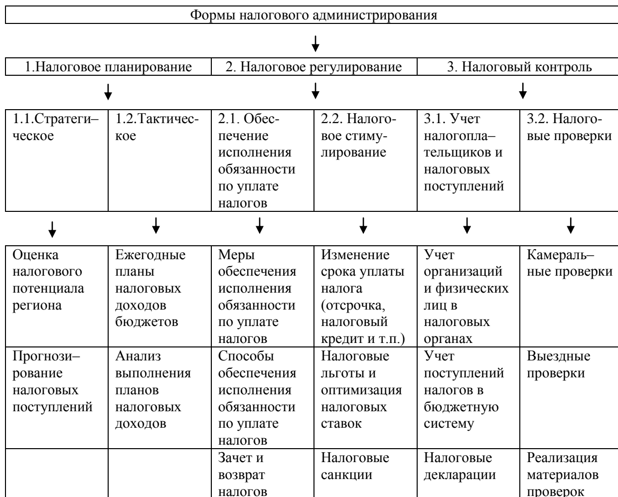
Рис.1.1. Методы и формы налогового администрирования

Совокупность форм налогового администрирования показана на рисунке 1.1.