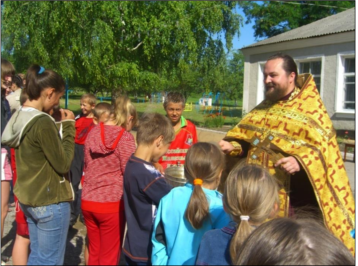
Православный лагерь «Ставрок»