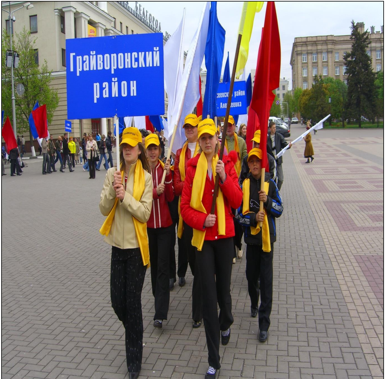
Делегация Почаевской СОШ в Белгороде