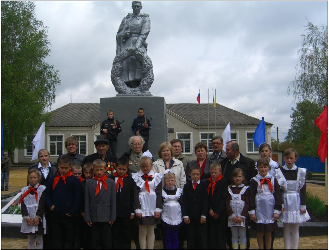
Митинг у памятника погибшим воинам