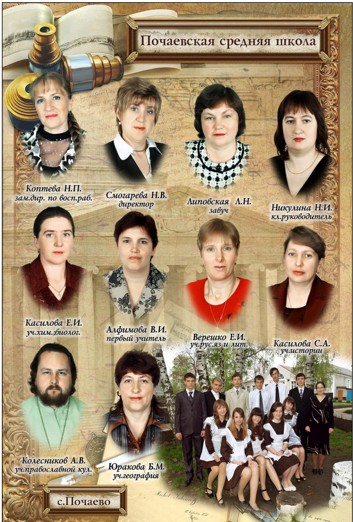
Педагогический коллектив школы