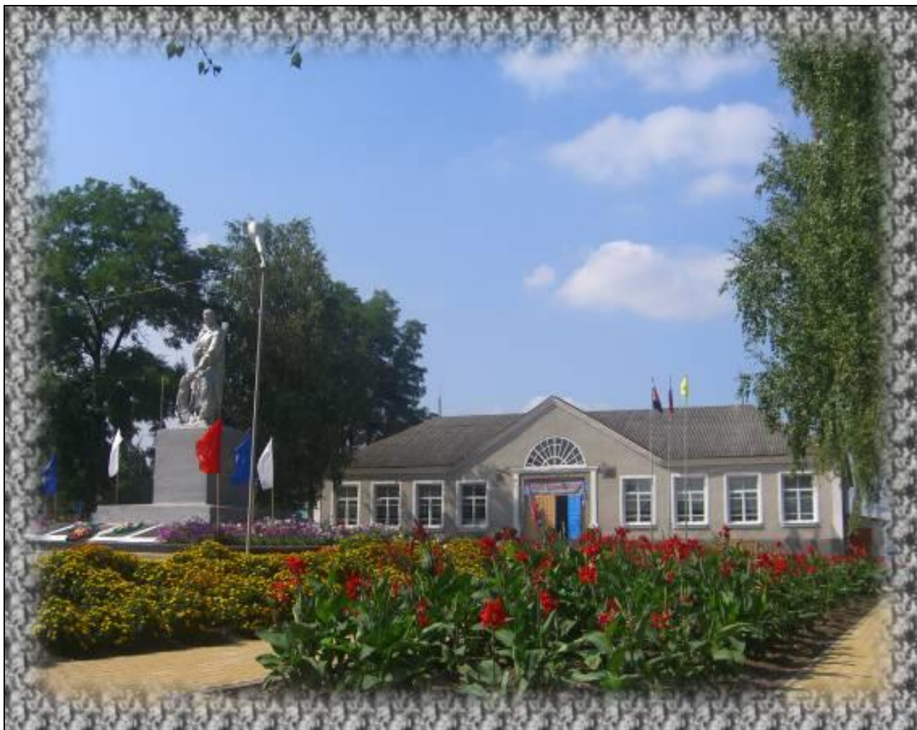
Почаевская средняя общеобразовательная школа