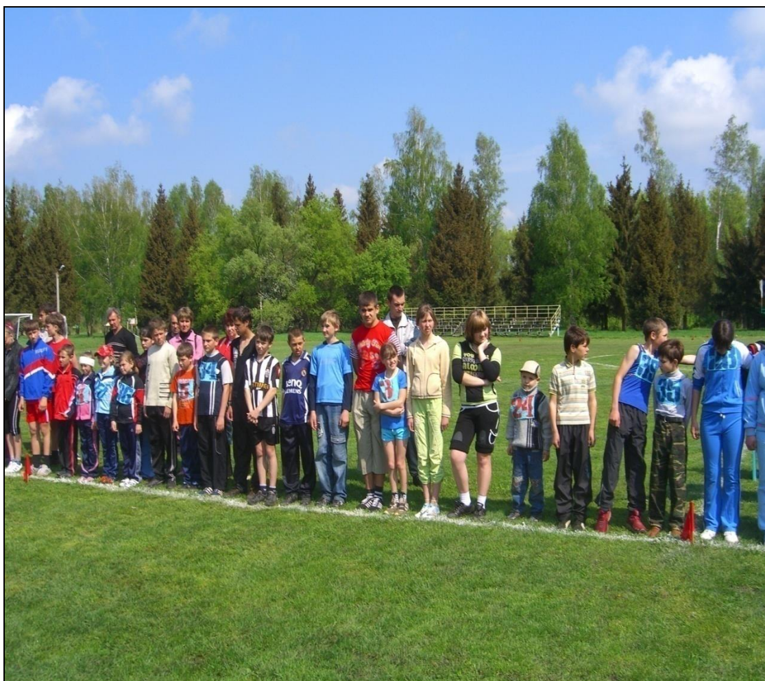
Спортивный праздник в школе