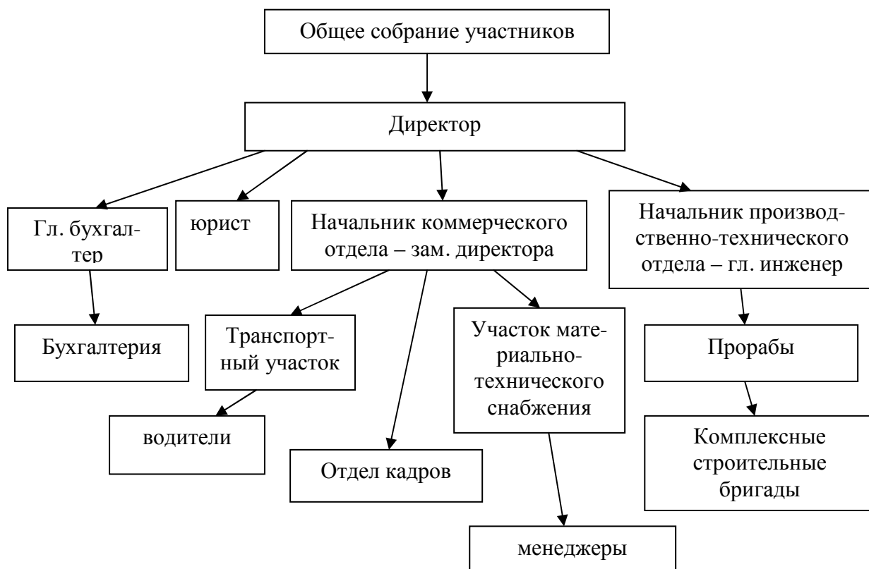
Рис. 2.1. Организационная структура ООО «Атлант Плюс».

К компетенции общего собрания участников общества с ограниченной ответственностью относятся: