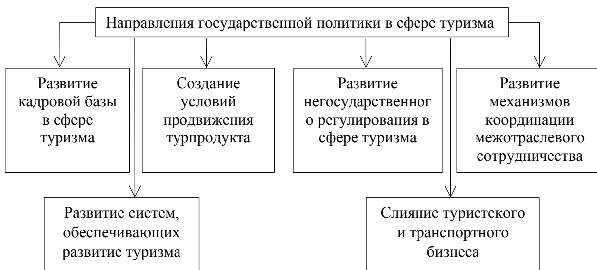
Рис. 1 Основные направления государственной политики сферы развития и поддержки туризма в регионе

Основные направления государственной политики сферы развития и поддержки туризма представлены на рисунке 1.