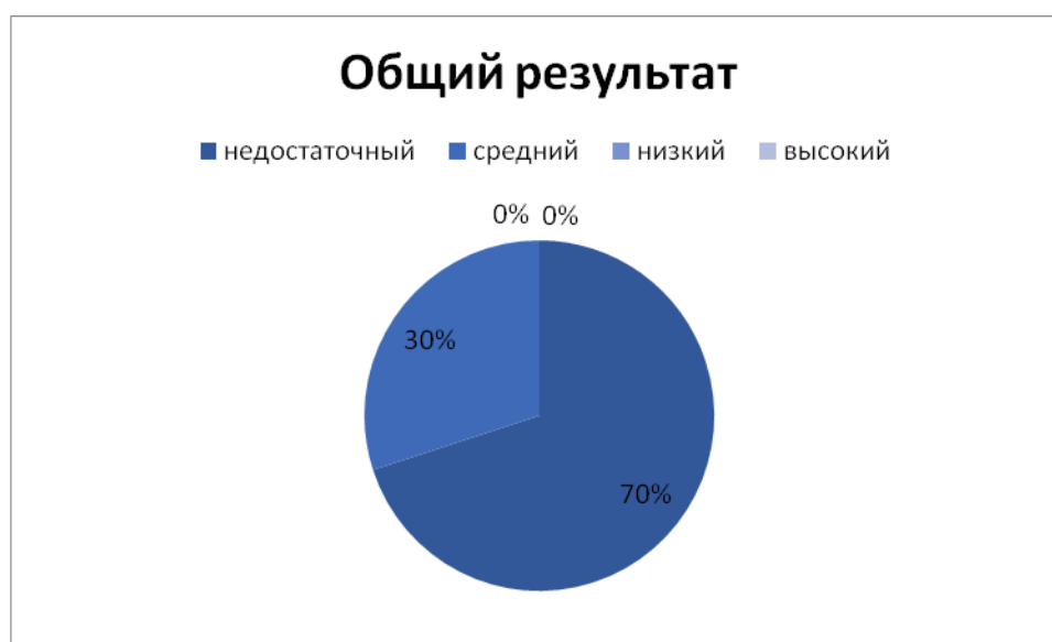
Рис. 2.3. Результаты диагностики творческого рассказывания у детей экспериментальной группы по 1 и 2 заданию

Из таблицы и графического изображения мы видим, что 30% старших дошкольников с общим недоразвитием речи имеют средний уровень сформированности данного навыка, недостаточный уровень имеют 70% экспериментальной группы.