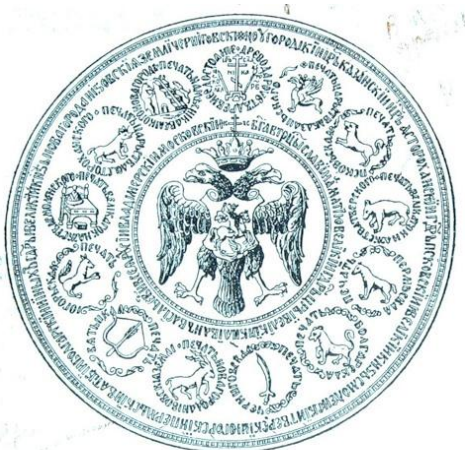
с. 143. Большая русская царская печать XVI века. Считается за печать Иоанна Грозного. Взято из [175], с. 160. См. также [93].

На печати 1497 года двуглавый орёл изображён с опущенными крыльями и с короной на каждой голове. Во времена Ивана Грозного на груди орла был помещён щиток с гербом московским - Святым Георгием, поражающим змия.