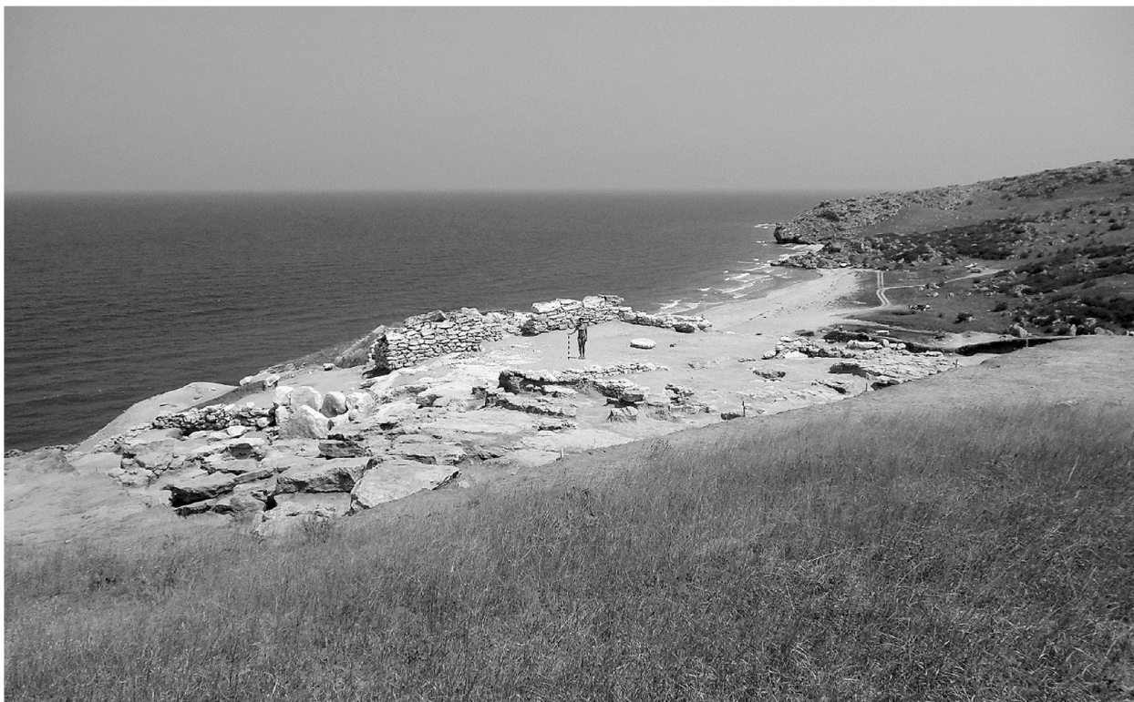
Фото 1. Городище Золотое Восточное — общий вид с юго-востока на раскопанную площадь, фото 2013 г (на заднем плане бухта с колодцами)