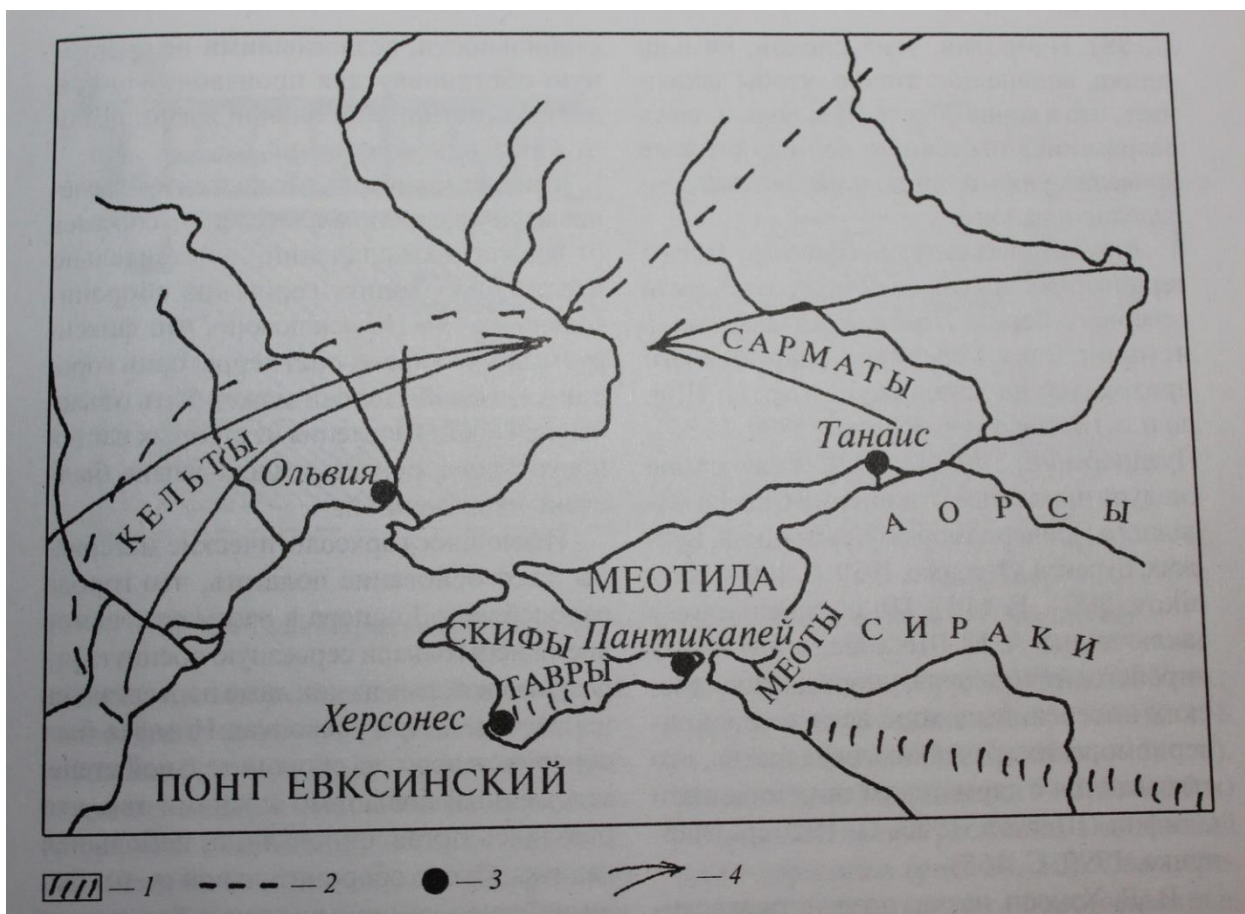
Карта 1. Северное Причерноморье после падения Великой Скифии. 1- горы; 2 – границы лесостепей и степей; 3 – главные греческие колонии; 4 – направления кельтских походов с запада и сарматских с востока.