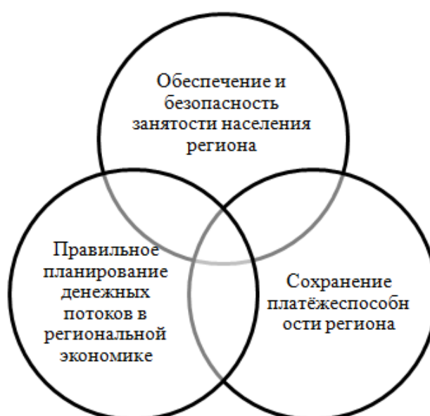
Рис. 2. Основные условия экономической безопасности региона

Обеспечение экономической безопасности региона – это реализация органами государственной власти, органами субъекта федерации и местного самоуправления во взаимодействии с институтами гражданского общества социально-экономических мер, направленных на противодействие угрозам экономической безопасности и удовлетворение интересов граждан региона.