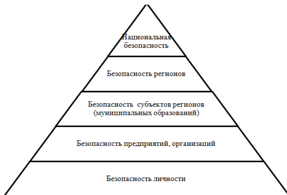
Рис. 1. Уровни безопасности

Понятие «регион» (лат. regio страна, область) в России используется в значении, как территориальная единица государства, субъект Федерации.