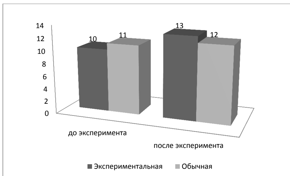
Рис. 3.2. Тест «Наклон вперед из положения сидя с прямыми ногами».

Таким образом, по результатам педагогического эксперимента мы можем судить об эффективности экспериментальной методики развития гибкости детей младшего школьного возраста на уроках физической культуры. Разработанная нами методика, в результате педагогического эксперимента показала свою высокую эффективность и может быть рекомендована к использованию учителям физической культуры для развития гибкости у учеников первых классов на уроках физической культуры.