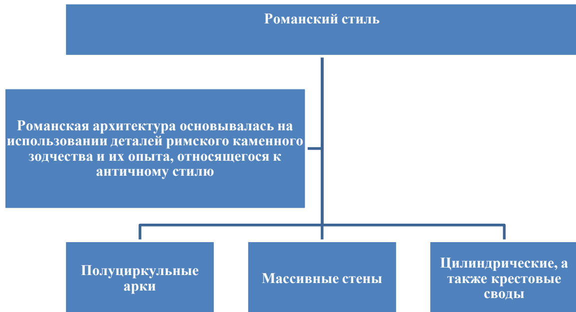
Рис 4 Сущность романского стиля церковной архитектуры XII-XIII веков и его основные черты

Важной задачей романского строительного искусства стало преобразование базилики с плоским деревянным перекрытием в сводчатую. Вначале сводом перекрывались небольшие пролеты боковых нефов и апсиды, позднее сводом стали перекрывать и главные нефы.