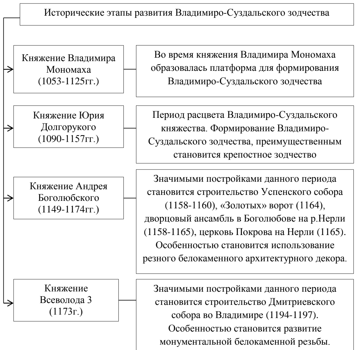
Рис 7 Основные исторические этапы развития владими́ро-суздальского зодчества

История Владимиро-Суздальского зодчества делится на ряд этапов, связанных с правлением Владимира Мономаха, Юрия Долгорукого, Андрея Боголюбского, Всеволода 3 и его наследников (рис. 7).