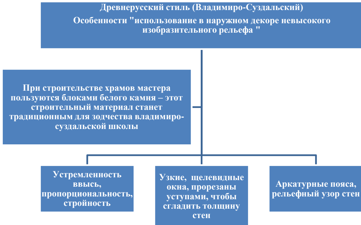
Рис 6 Сущность древнерусского стиля церковной архитектуры и его основные черты

Сущность древнерусского стиля церковной архитектуры и его основные черты приведены на рисунке 6.