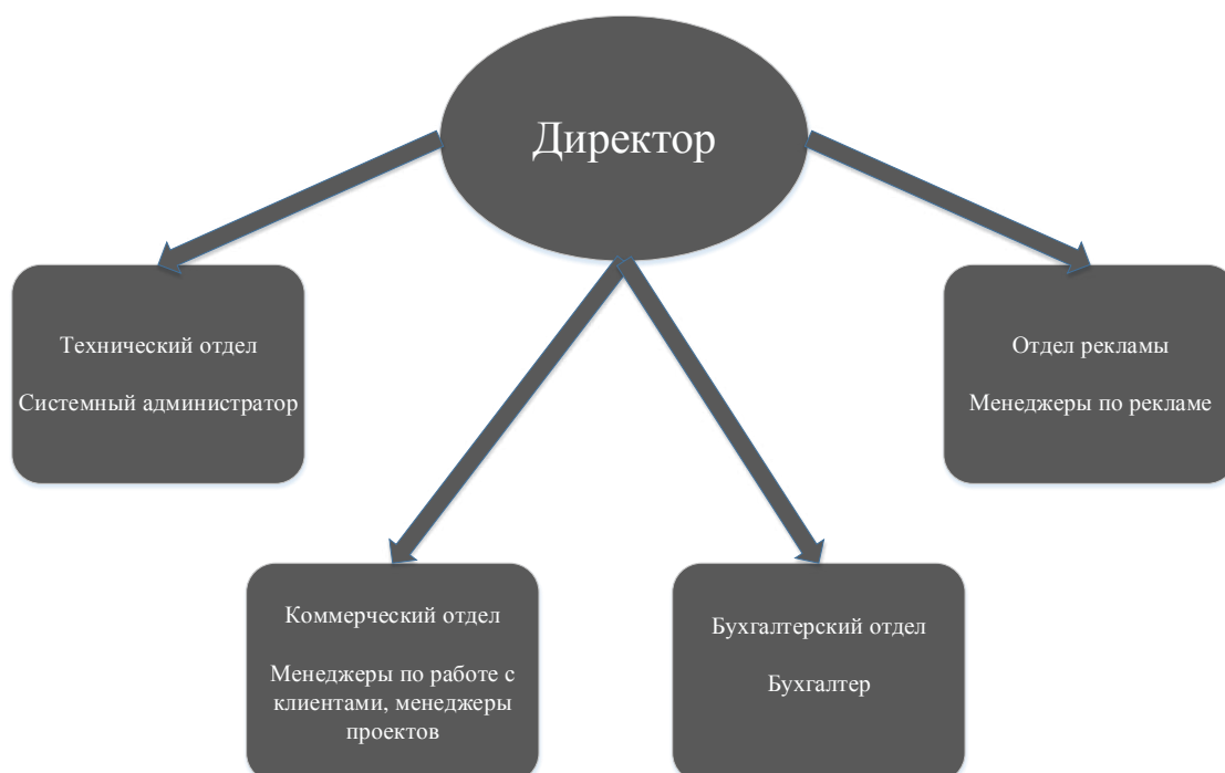
Рисунок 2.1.1 – Организационная структура ООО «Ветер перемен»

В организации ООО «Ветер перемен» функционируют 4 отдела: коммерческий, технический, бухгалтерский и отдел рекламы. Структура организации показана на рисунке 2.1.1.