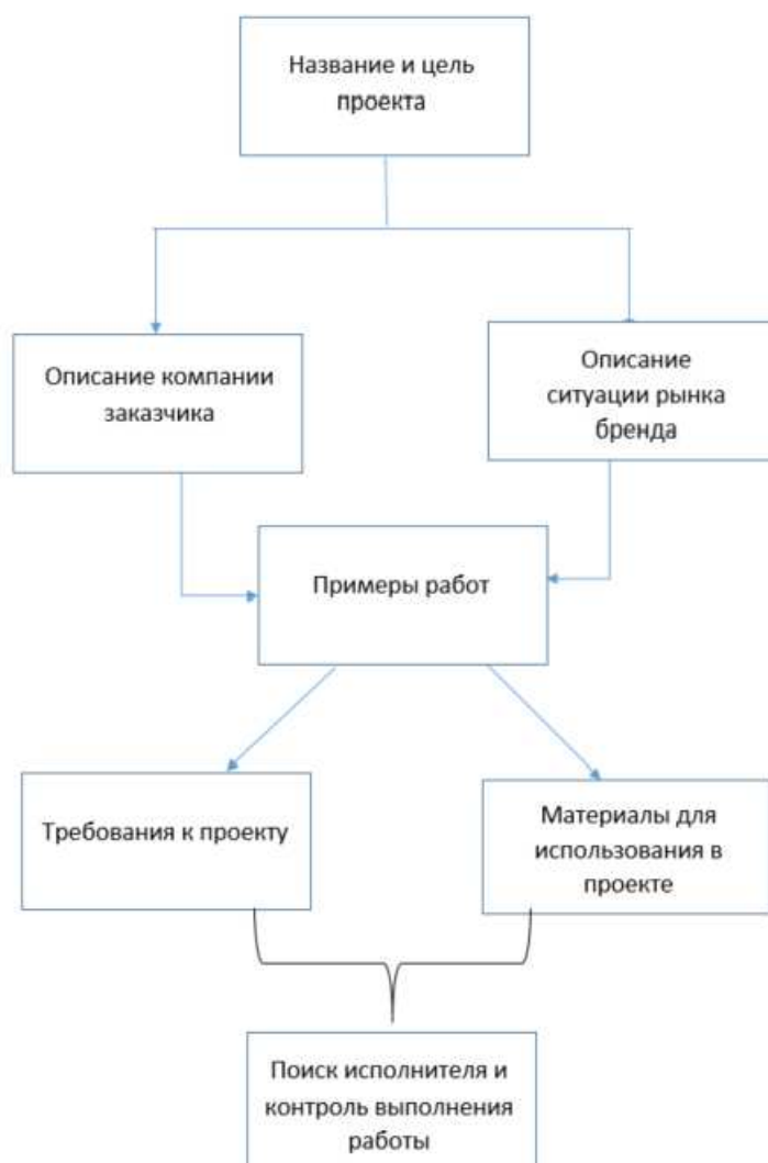
Рис.1.2.1. – Структура технического задания

Структура технического задания представлена на рис.1.2.1