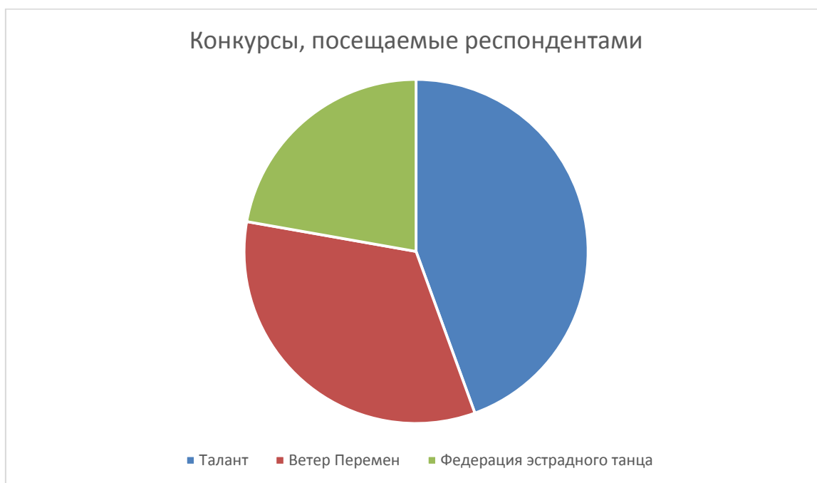
Рис. 2.2.1 – Конкурсы, посещаемые респондентами

Большая часть респондентов, относилась к возрастной группе от 28 до 55, то есть преподаватели и хореографы, которые имеют влияние на детей и их родителей.