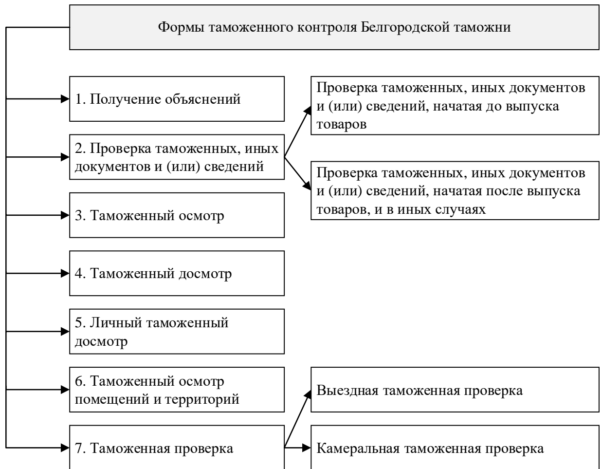
Рис. 1. Формы таможенного контроля Белгородской таможни

Поэтому при организации таможенного контроля Белгородская таможня основывается на приказах, инструкциях, рекомендациях ФТС России и регламентирует действия своих должностных лиц для каждой формы таможенного контроля.