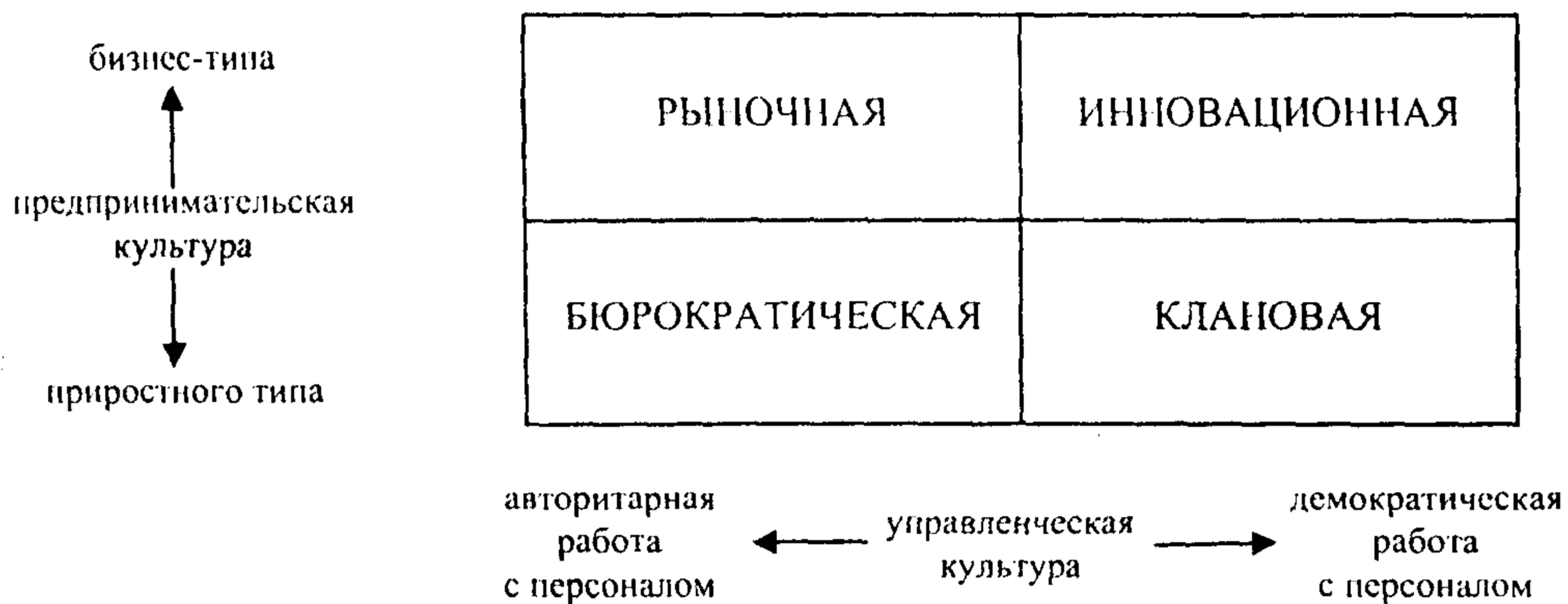
Рис. 3. Концептуальная модель типов организационной культуры

Взяв за основу исследования методику OSAI, предлагаем также рассматривать четыре типа организационной культуры. «Рыночный» и «клановый» типы культуры организации можно назвать универсальными, они уместны для характеристик типов культуры российских организаций. А к «иерархическому» и «адхократическому» типам организационной культуры, выделяемым Камероном и Куинном, в российских организациях наиболее адекватно применение типологии «бюрократическая» и «инновационная» культура организации.