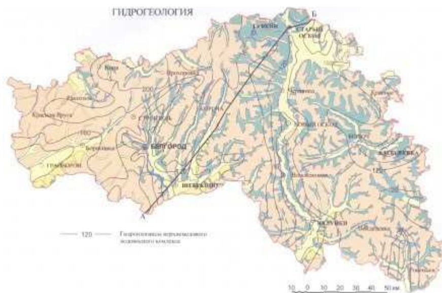
Рисунок 1.2 — Гидрогеологическая карта Белгородской области

При анализе гидрогеологической карты Белгородской области (рис.1.2) и гидрогеологической карты бассейна КМА (Курская магнитная аномалия) можно увидеть, что в разных частях области первыми от поверхности залегают различные водоносные горизонты. Так в западной части области (Краснояружский, Ракитянский, Ивнянский, Борисовский, Грайворонский районы) широко представлен полтавско-харьковский водоносный горизонт палеоген-неогенового возраста, сложенный песками, глинами, песчаниками, алевритами, глинами. Фрагментарно в долинах рек и иных эрозионных формах на поверхность выходят бучакско-каневские слои палеогена (пески различной зернистости с прослоями глин, алевриты, песчаники, опоки, глины), турон-маастрихтский горизонт (мел, мергели), верхне-среднечетвертичный и современный аллювиальные водоносные горизонты (пески, галечники с прослоями супесей, суглинков, глин, супеси, суглинки). В оставшейся части области доля палеогеновых слоев снижается, так как нарастают выходы турон-маастрихтского мезозойского горизонта.