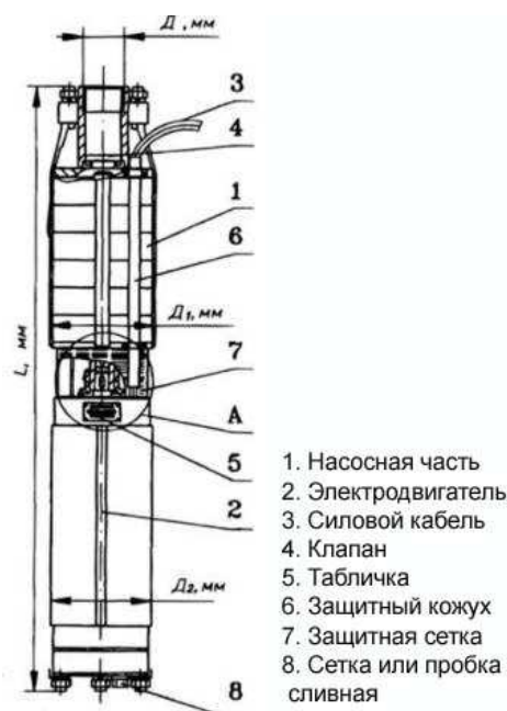
Рисунок 3.2— Насос ЭЦВ в разрезе

На рисунке 3.2 изображен насос ЭЦВ в разрезе.