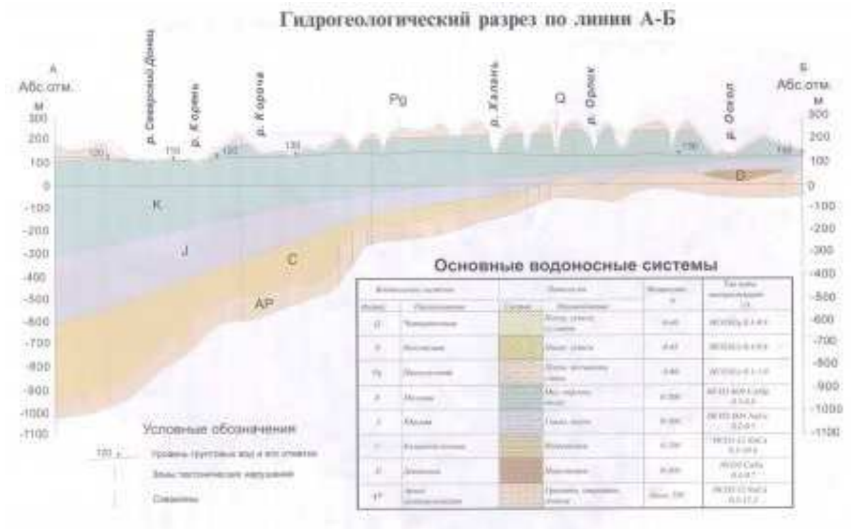
Рисунок 1.3 — Гидрогеологический разрез Белгородской области по линии А-Б

В гидрогеологическом отношении Губкинский район приурочен к Донецко-Донскому артезианскому бассейну.