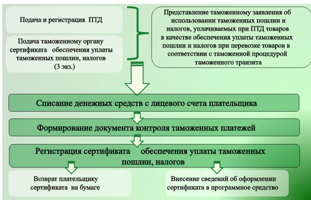
Рис.2. Технология использования обеспечения таможенного транзита при предварительном декларировании товаров

Порядок использования Единой автоматизированной информационной системы таможенных органов Белгородской области при таможенном контроле, таможенном декларировании и выпуске (отказе в выпуске) товаров, помещаемых под таможенную процедуру таможенного транзита, в электронной форме (далее - Порядок) определяет последовательность действий по использованию Единой автоматизированной информационной системы таможенных органов (далее - ЕАИС таможенных органов) при: