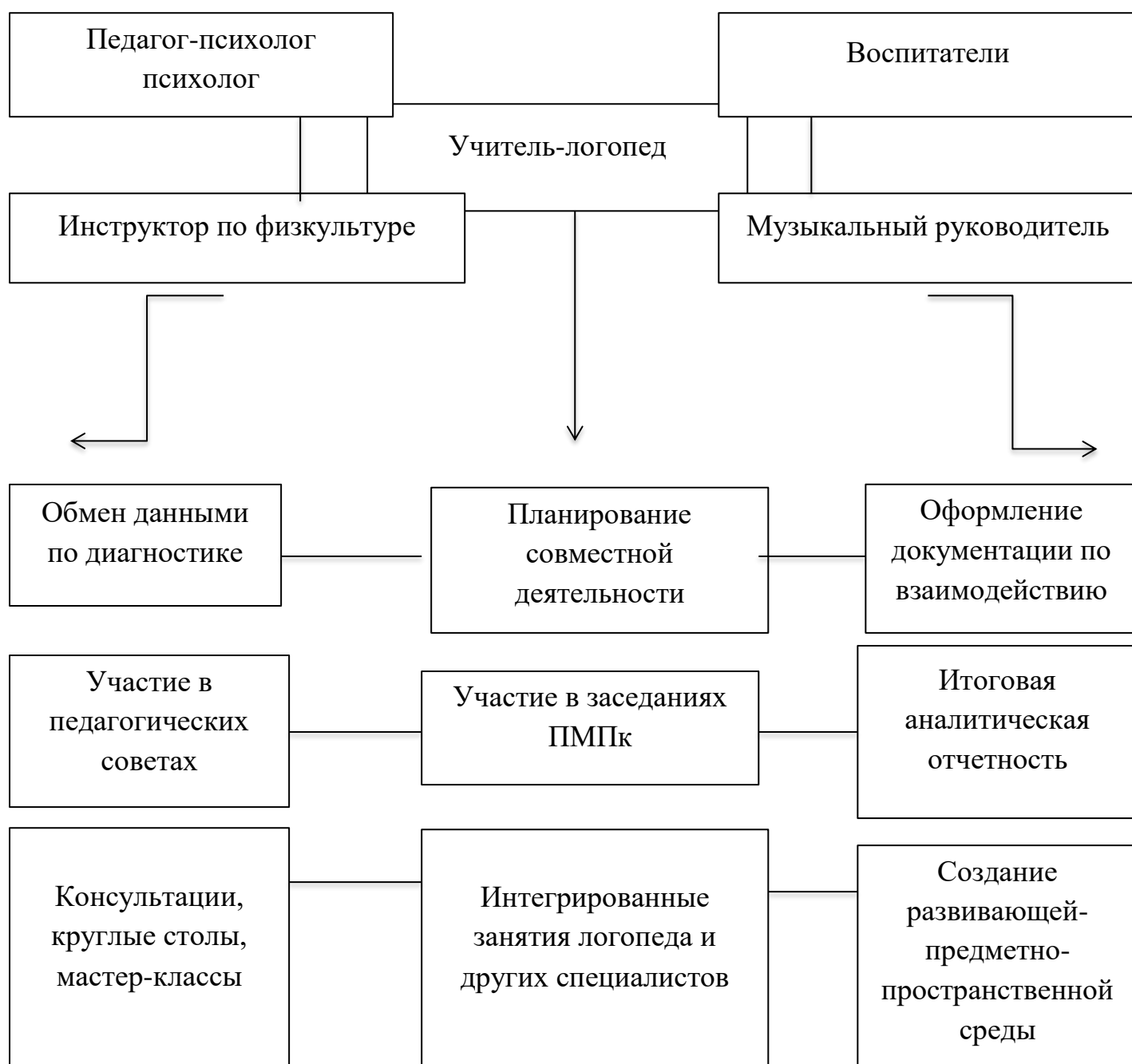
Рис.2.5 «Формы взаимодействия специалистов ДОУ»

На рис. 2.5 представлены основные формы взаимодействия логопеда и других специалистов ДОУ.