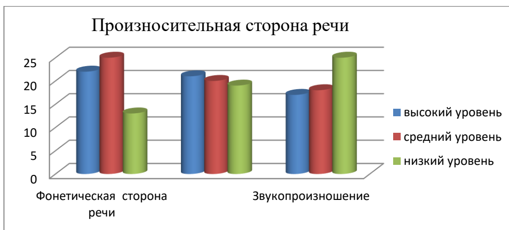
Рис. 2.3 « Изучение произносительной стороны речи»

На рис. 2.3 видны результаты исследования произносительной стороны речи.