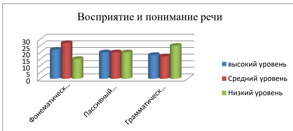
Рис. 2.1 « Изучение восприятия и понимания речи»

-исследование грамматического строя (импрессивной речи): высокий уровень-30%,средний-28%, низкий-42%. На рисунке 1 представлены результаты изучения восприятия и понимания речи.